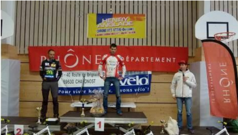
Podium du 46km