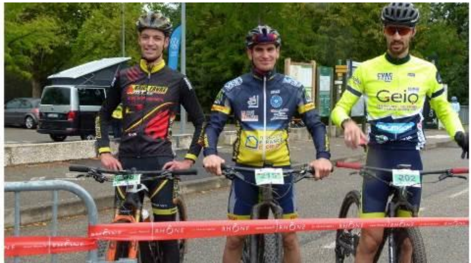
Les 3 premiers du 35km