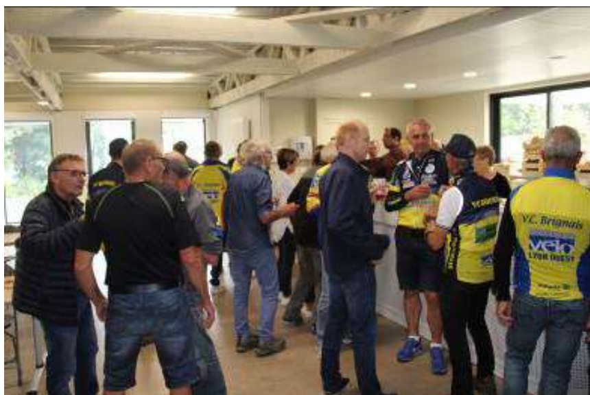
Après l'effort.... le réconfort