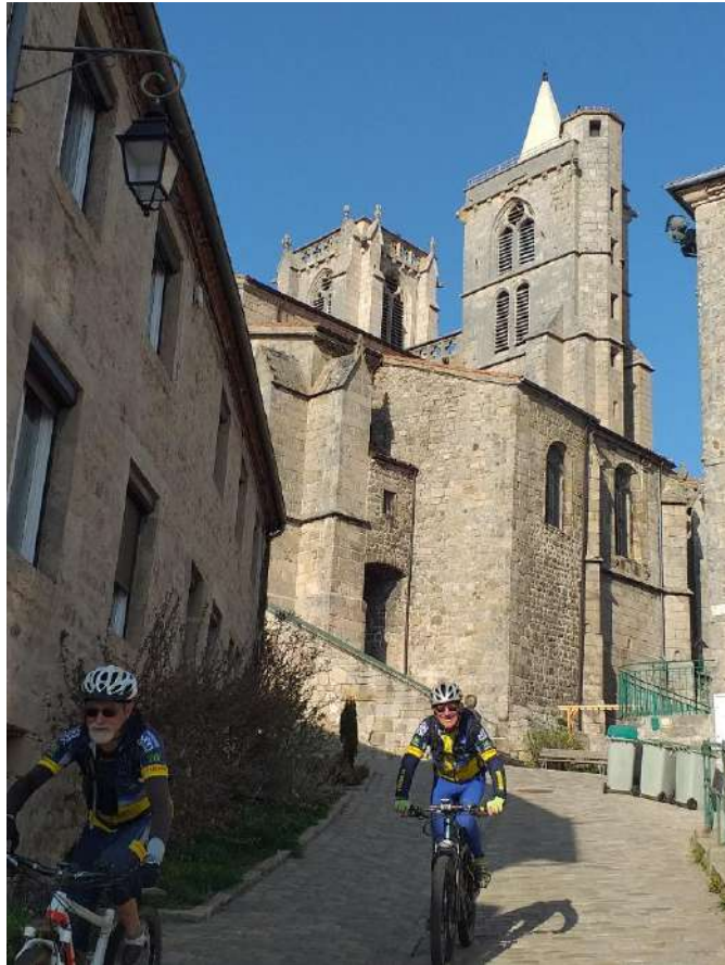
Pavés dans St Bonnet Pierre rentre avec batterie à plat Au final 66km et 1640m de D+ Moyenne 12,5km/h

17h retour vers Brignais 19h on est à la maison