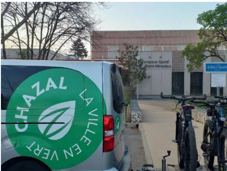
7h30 tout est prêt pour le départ Remorque attelée