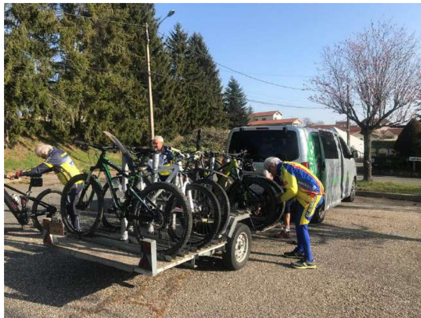
8h45 déchargement à St Bonnet