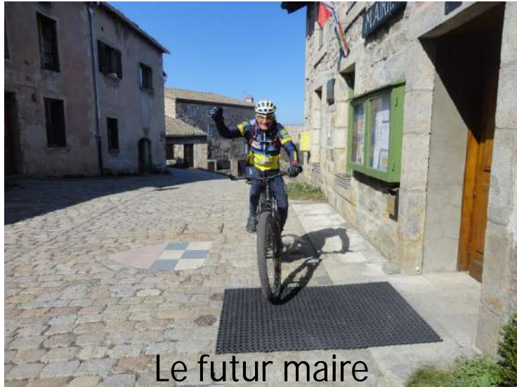
Le futur maire