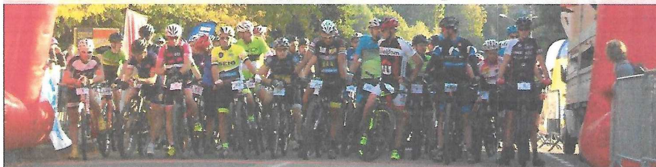
■ Le départ des vététistes (devancés par les guides à moto), dès 9 heures, est toujours très impressionnant.